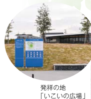
発祥の地 「いこいの広場」