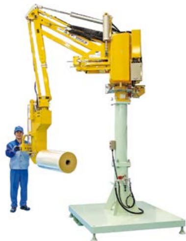
ラクラクハンド エア式と電気式で人の手に追従する フレキシブルなハンドクレーン

完全自動化できず、人の手が必要な作業をサポートし続けている「ラクラクハンド」。“人に寄り添う、手クノロジー”を駆使し、オーダーメイドで一台ずつ丁寧に創り上げることで、世界各地の多様な分野で活用されています。