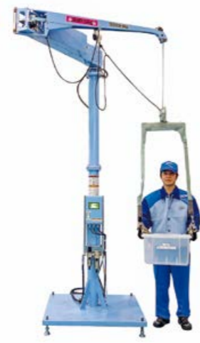
ハンディーハンド 形や大きさ、重さの違いを問わず、 手で持てるものなら何でもアシスト