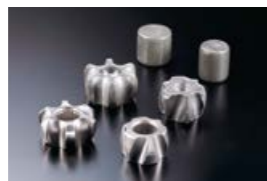
等速ジョイント内輪

素材からの成形で、切削と同レベルの高精度ネットシェイプを追求した「精密冷間鍛造」。長年の開発ノウハウと、脈々と受け継がれた創意工夫の精神によって、世界No.1精度の精密冷間鍛造に挑戦しています。