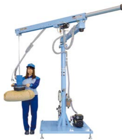
カンタンハンド 袋やカートンを吸着して運ぶ専用機